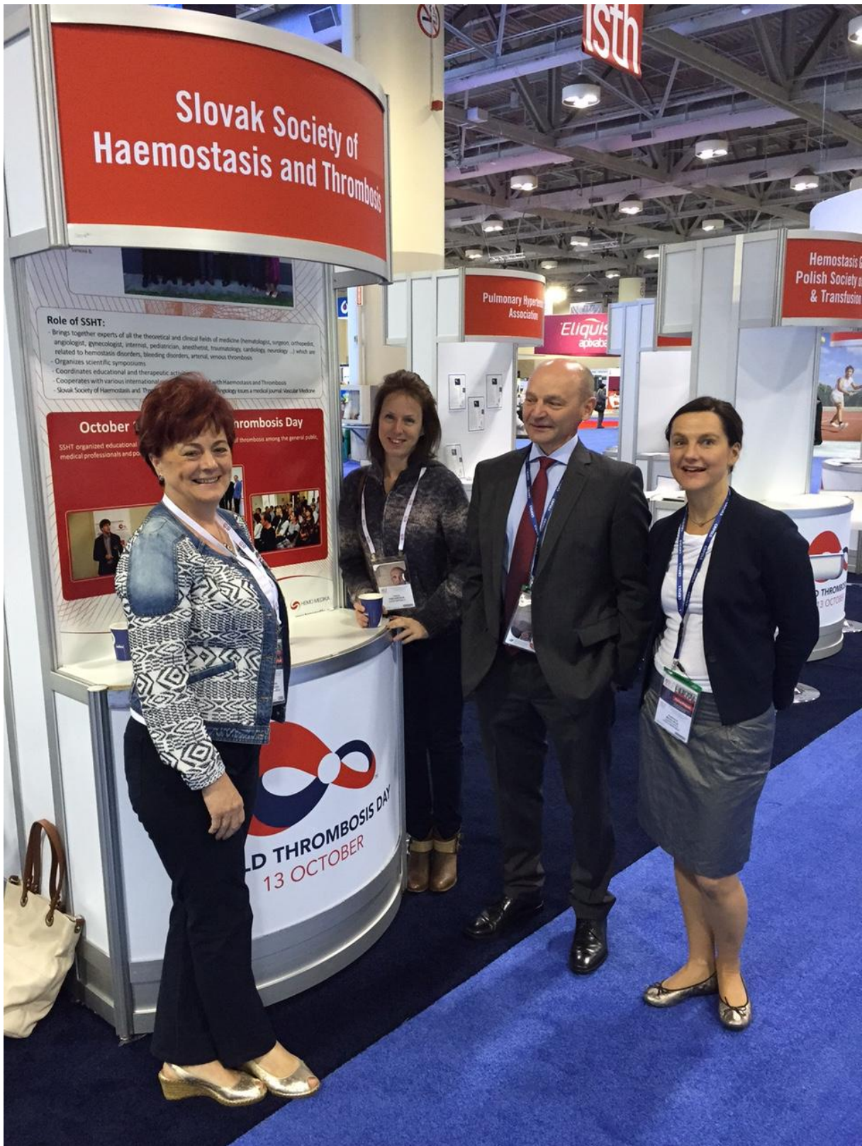
Stánok Slovenskej spoločnosti pre hemostázu a trombózu